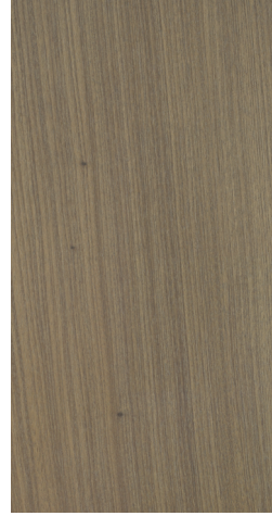
BQ M503 Warm Taupe