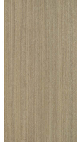
BQ M504 Smokey Beige